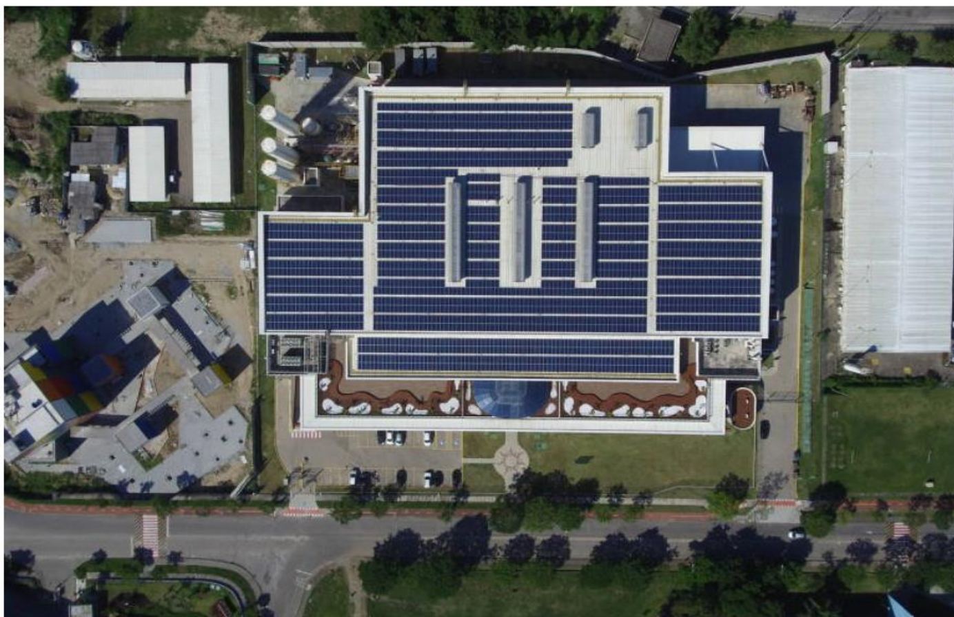
Placas solares instaladas no Centro de Inovação da cervejaria Ambev, localizado no Parque Tecnológico da UFRJ, no Rio; Instalação foi feita pela Enel.

A mudança nas regras em discussão na Aneel (agência reguladora do setor) impulsiona um boom de investimentos —especificamente na chamada geração distribuída.