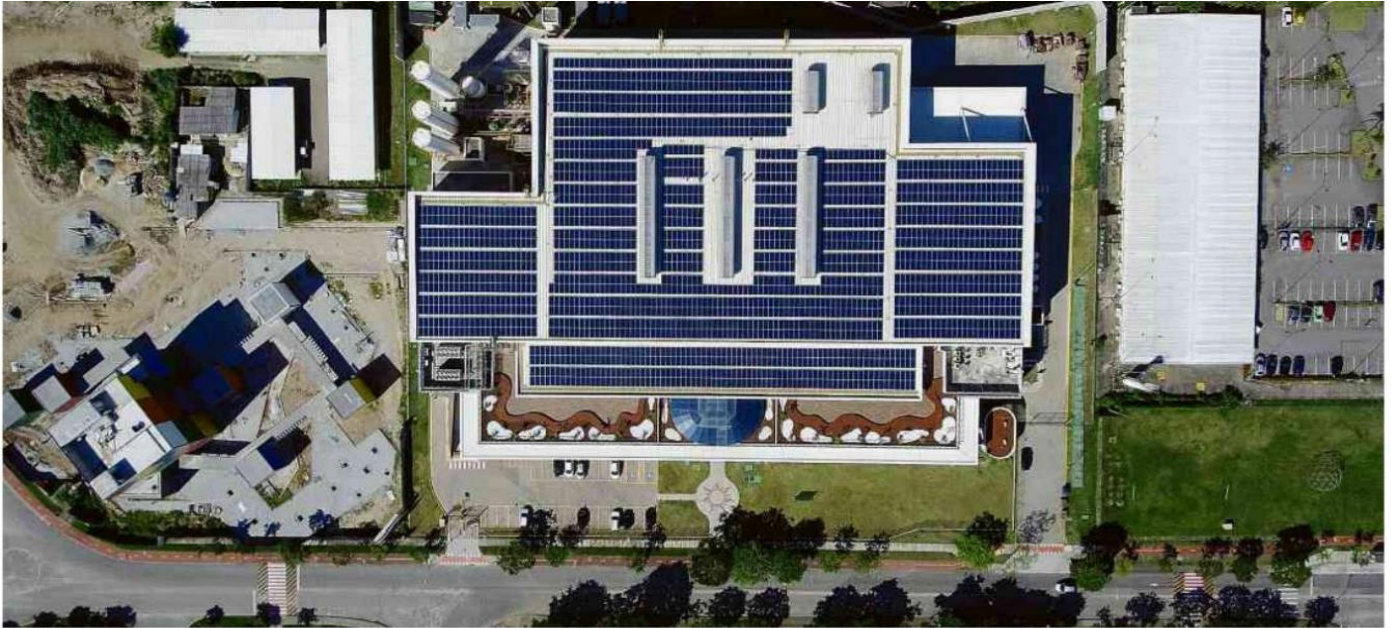
Centro de inovação da cervejaria Ambev, no Rio de Janeiro, tem cerca de 2.000 placas solares; projeto de geração distribuída foi feito pela Enel