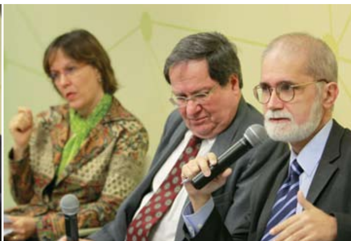
Os debatedores enxergam a necessidade de maior interação entre os programas do governo e o Plano Nacional sobre Mudanças do Clima.